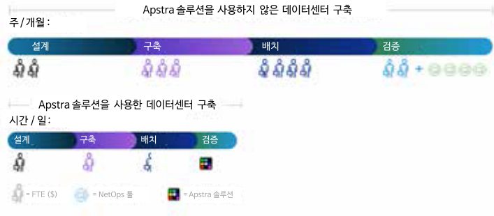
그림 2: 자동화는 효율성을 향상시킵니다.

데이터센터 구축은 점차 복잡해지고 있습니다. 특히 노드별 수동 설정과 프로비저닝의 경우 더욱 그렇습니다. 이는 오류, 비밀관성, 지연 발생으로 이어질 수 있습니다. Apstra는 단일벤더 및 멀티벤더 스위치 환경과 광범위한 네트워크 운영 체제를 모두 지원하여 네트워크 구현을 획기적으로 간소화합니다. 기업은 Apstra 시스템의 개방형 아키텍처를 활용해 먼저 비즈니스 요구 사항을 충족하는 네트워크를 설계한 다음, 해당 설계에 가장 적합한 하드웨어를 선택할 수 있습니다.