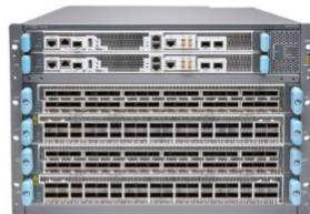
PTX10004 Packet Transport Router