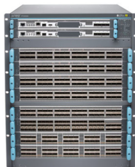
PTX10008 Packet Transport Router